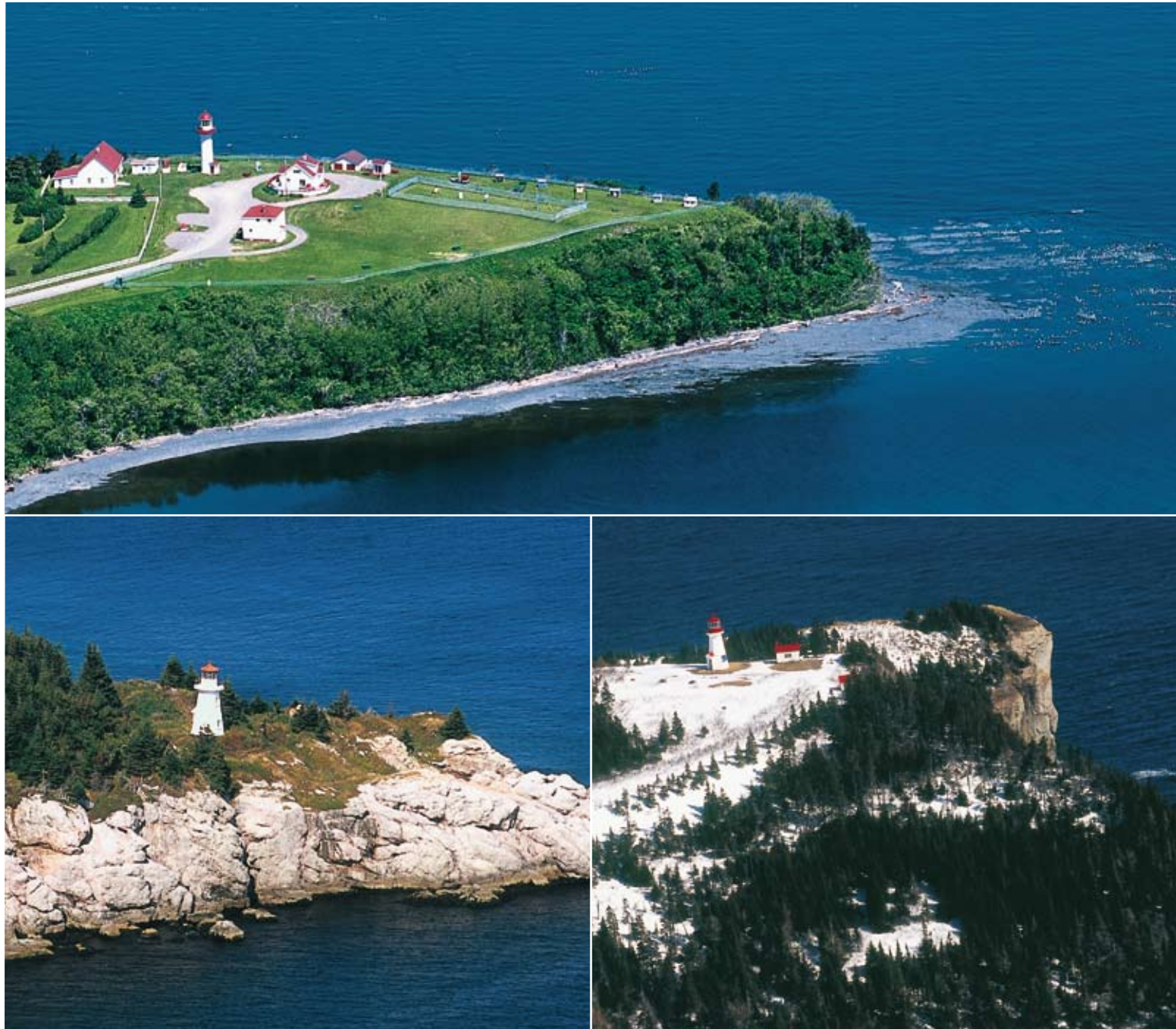
Le cap de la Madeleine, Port-Daniel et le cap Gaspé, trois relais de la longue chaîne des « sentinelles du Saint-Laurent » qui ponctuent la dentelle littorale de la Gaspésie.