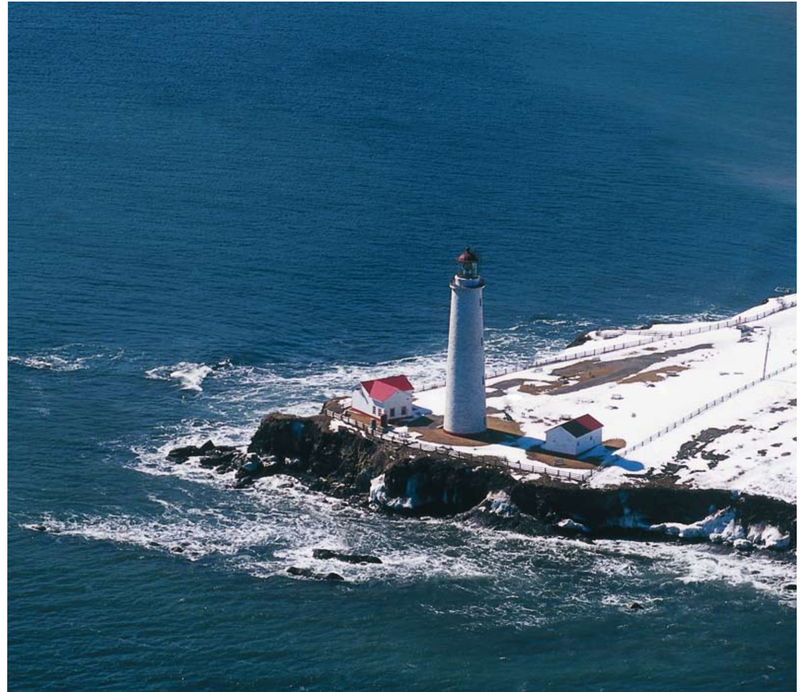
Classé monument historique, le phare du cap des Rosiers fut l'un des premiers à remplir la noble fonction de gardien de sécurité des navigateurs du Saint-Laurent... et pour cause: les naufrages y ont été très nombreux.